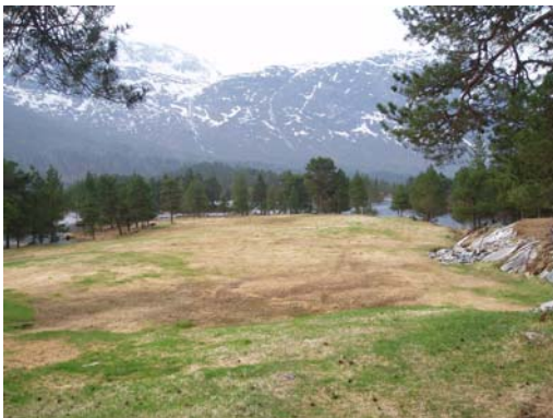
Området ned mot odden i elva.

Planområdet er stort sett flatt ut mot ein odde i elva og heller svakt skrånande ned mot dette. I sør/vestre del av planområdet er det ei vik i elva der terrenget er til dels bratt mot hovudvegen. Det er ein del naturleg vegetasjon i området og mykje av denne bør takast vare på. Vegetasjon kan nyttast for å skjerme areala mot innsyn frå vegen, for å dele opp areala slik at ein får mindre, intime areal, skjerme eksisterande bustad m.m. Vegetasjon langs elva er med på å hindre utgraving av elvebreidda og gir dessutan eit godt grunnlag for fugle- og insektliv.