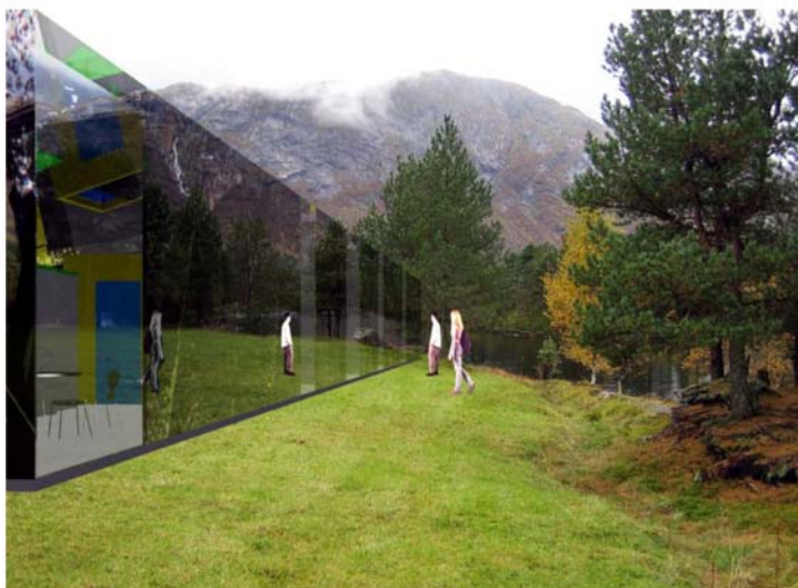
Illustrasjon frå prosjektet Trollspegelen som viser planlagt bygg i landskapet.

Turisme i Noreg er i stor grad knytta til naturen. Landskapskvalitetar må derfor stå i fokus under planlegging og gjennomføring av tiltak. Utanlandske turistar er ofte opptatt av å sjå og oppleve fjord-, kyst- og høgfjellslandskap. Opplevingar langs vegen er vesentleg for å kunne oppfylle turistane sine forventningar. Turistvegprosjektet si målsetting er å skape turistvennlege vegar og gi turistane ei landskapsoppleving i eit samarbeid mellom reiseliv, kommunar og andre lokale og regionale instansar. Designet for Trollspegelen er tufta på desse overordna intensjonane om utforming av anlegg i tilknytning til Nasjonale turistvegar.