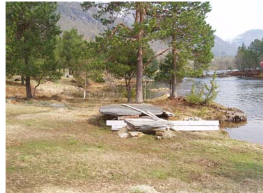
Området langs elvebreidda.