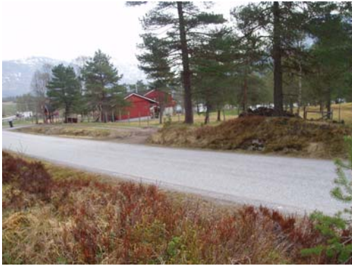
Eksisterende avkjørsel frå riksvegen.

Arealavgrensinga mot vest går i senter av Rv13, og i aust går den ute i elva. Planen grensar inn til reguleringsplan for Likholefossen i sør/sørvest. Plangrensa ligg 10m frå tomtegrensa til gnr.17, bnr.12/16 mot nordaust og vidare ned til elva.