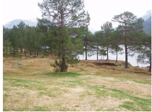
Elva avgrensar området i sør.