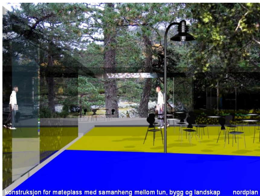
konstruksjon for møteplass med samanheng mellom tun, bygg og landskap nordplan I skisseprosjektet ligger det ein intensjon om eit nært samspel mellom natur og bygg.