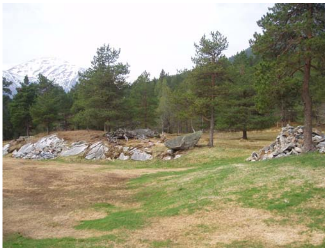
Berget som ligg innanfor Sp-Fr1

I Sp-Fr1, rett aust for område for fritidsbusetnad ligg eit ope berg som bør behaldast, dette gir ein variasjon i planområdet som elles består av flater/mark og furuskog.