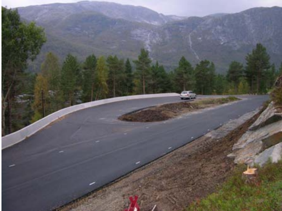
Bussholdeplassen langs riksvegen innanfor planområdet.

Busshaldeplassen ved riksvegen inngår i reguleringsområdet og ligg mellom parkeringsplassen til Likholefossen og det planlagde nye turistområdet.